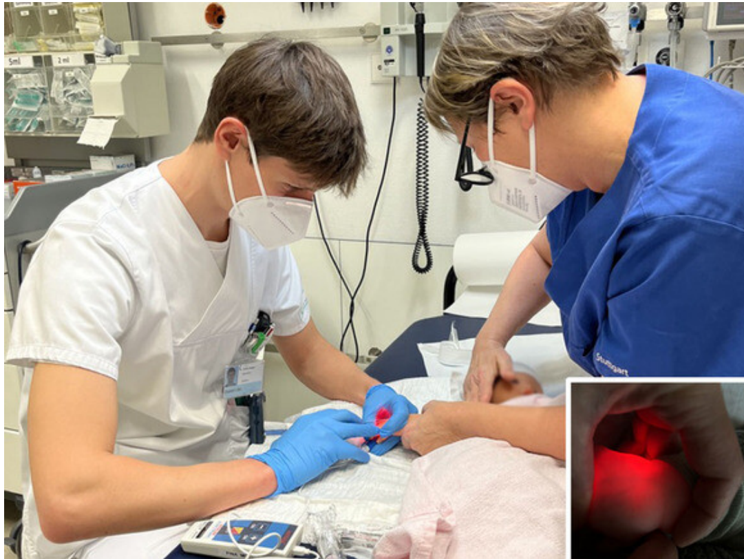
Das neue Venensuchgerät im Einsatz in der Notaufnahme

Den meisten kleinen Patienten graut es vor einer Blutabnahme - und auch für Eltern und Ärzte ist die Situation oft sehr herausfordernd. In der pädiatrischen Notaufnahme PINA sorgt nun ein Venensuchgerät für Erleichterung, vor allem bei Säuglingen und kleinen Kindern: Dank des Infrarotlasers werden die "Blut-Autobahnen" viel besser sichtbar und die Piekse für die Blutabnahme sind gleich beim ersten Mal erfolgreich.