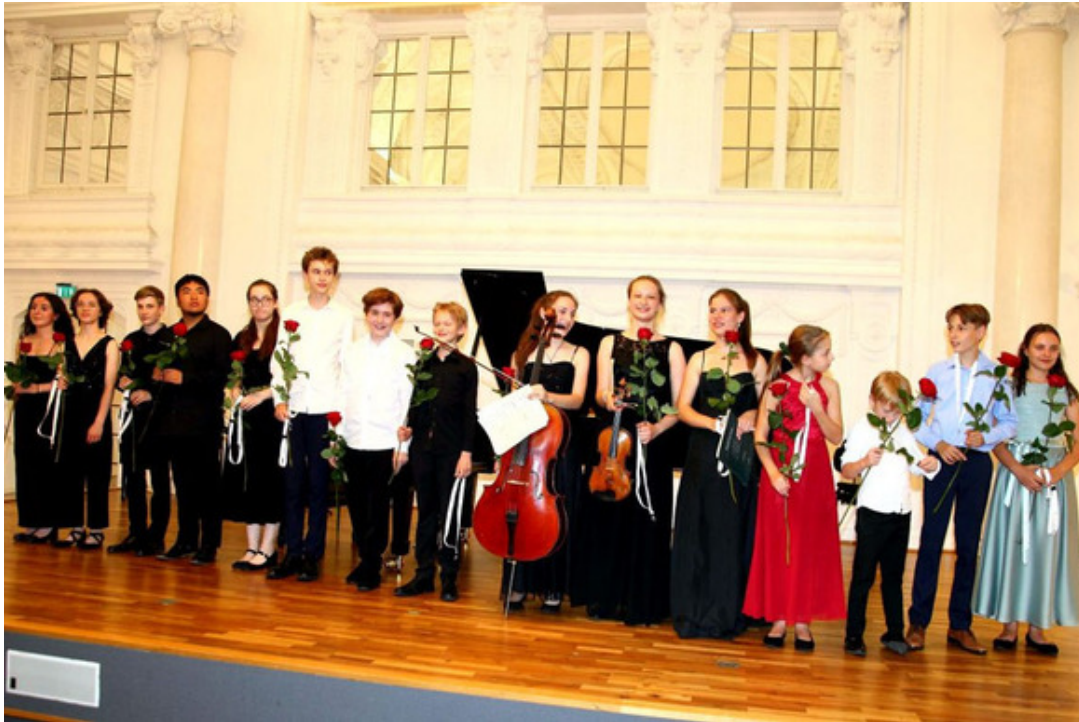
Die jungen Musikerinnen und Musiker begeisterten das Publikum im Weißen Saal im Neuen Schloss