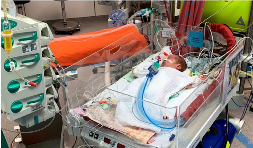
Eines der beiden neuen Beatmungsgeräte im Einsatz

Mit zwei neuen von der Olgäle-Stiftung angeschafften Transportbeatmungsgeräten „Hamilton T1“ können die kleinsten Patienten ab einem Körpergewicht von 300 Gramm viel besser beatmet werden: der früher genutzte einfache Handbeatmungsbeutel entfällt und die Geräte bieten eine Vielzahl von Beatmungsmodi inklusive einem Reanimationsmodus. Dadurch können Krankentransporte viel sicherer durchgeführt werden – so wie etwa bei einem kleinen zweijährigen krebskranken Mädchen, das optimal beatmet in seinem Bettchen zwischen dem Kernspintomographen im Olgäle zum Computertomogramm in das benachbarte Haus F und zurück transportiert werden konnte; oder wie bei einer kleinen neugeborenen Patientin, die von der Neonatologie über den OP auf die Kinderintensivstation MC21 transportiert wurde (Foto). Dank dieser neuen Geräte im Wert von insgesamt knapp 54.000 € werden den Kindern zudem mehrere einzelne Narkosen erspart.