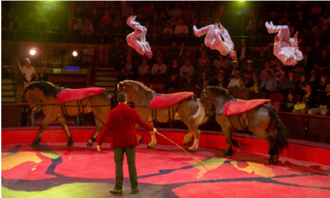
Weltweihnachtscircus 2021