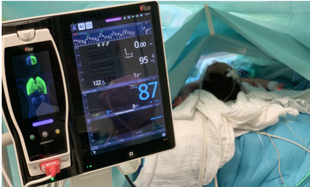
Der Sauerstoffstatus wird genau überwacht

Wenn kranke oder zu früh geborene Babys Sauerstoff benötigen, ist die richtige Dosierung sehr entscheidend, denn wenn kleine Kinder zu viel Sauerstoff erhalten, kann dies im schlimmsten Fall zu Augenschäden führen. Mithilfe des „ORI“ (Oxygen Reserve Index) kann mit Licht am Finger permanent und nicht-invasiv der Sauerstoffstatus überwacht werden. Dank einer Spende der Volksbank Zuffenhausen eG aus ihrer Gewinnsparr-Aktion in Höhe von 4.500 Euro kann die Anästhesie die kleinen Patienten nun mit dem „ORI“ noch genauer und sicherer überwachen. Darüber hinaus durfte sich das Sozialpädiatrische Zentrum (SPZ) über einen Still- und Ruhesessel für den Wartebereich freuen.