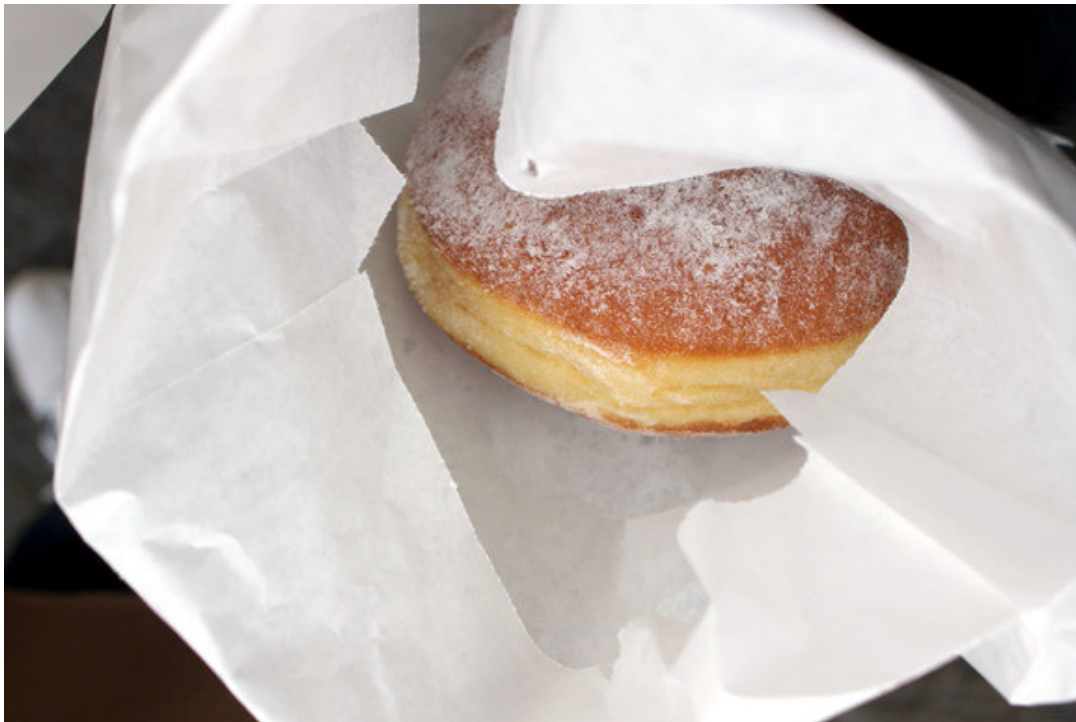
Einer der leckeren Berliner der Panetteria Haag

Was wäre die Faschingszeit ohne Berliner? Die Panetteria Haag aus Schwaikheim wollte den kleinen Patient*innen zu Fasching eine Freude bereiten und übergab der Olgäle-Stiftung pünktlich zum Rosenmontag 180 frisch gebackene Berliner, die gleich im Anschluss auf den Stationen verteilt wurden. Wir danken sehr herzlich für das wiederholte Versüßen des Klinikalltags.