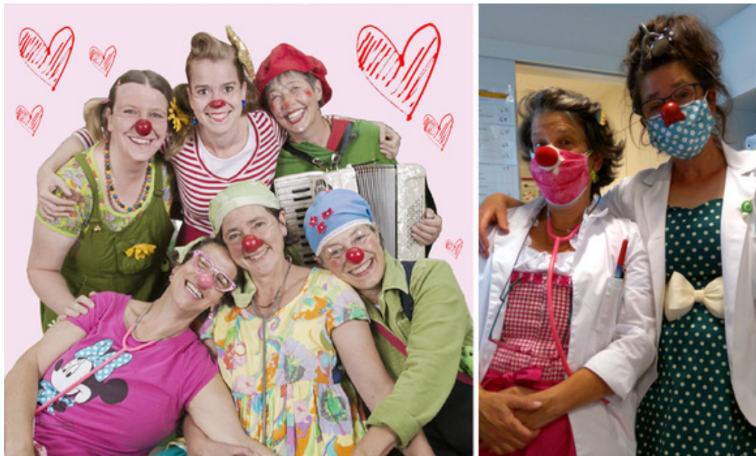
Gruppenbild (v.l.o.nach r.u.): Bubu Baum, Lametta Zamperoni, PaPüff, Dr. Praline von der Schachtel, Doktor Plüsch, Dr. Klops

https://www.klinikum-stuttgart.de/aktuell-im-klinikum/kinder-unterhaltung/bubu-baum-und-lametta