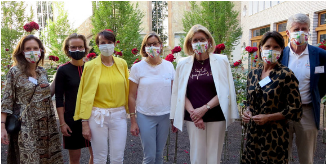
Vorstand der Olgäle Stiftung im Rosengarten des Hospitalhofs

Liebe Mitglieder und Freunde der Olgäle-Stiftung,